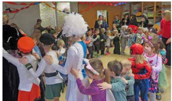
Gemeinsam wurden Faschingslieder gesungen und eine Polonäse, angeführt von der Prinzessin, durchgeführt.

Wie auch in den letzten Jahren war wieder das Funkenmariechen dabei, die Kindergartenkinder waren total begeistert von ihrem Tanz. Elwedritsche waren auch dabei, die Kinder hatten aber keine Angst, da sie ihre Masken nicht aufgesetzt hatten.