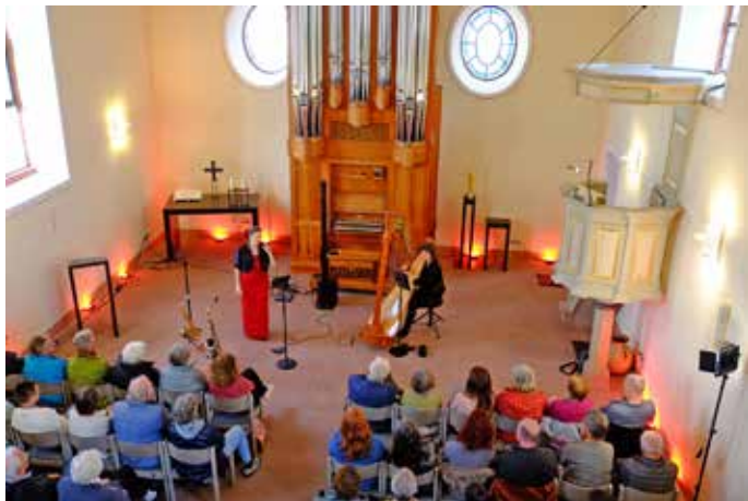
Die Gaiberger Peterskirche war bei „Celtic meets Tango“ bis auf den letzten Platz besetzt.