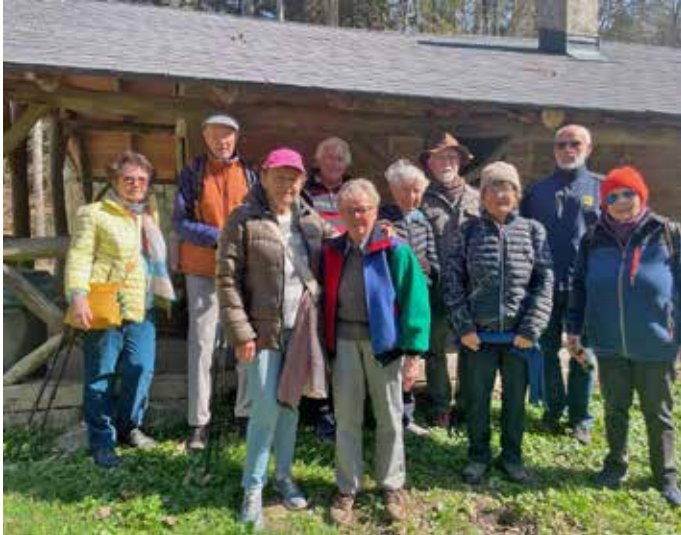
Vor der Hütte am Steinernen Tisch

Wir fuhren dieses Mal nach Lobbach und starteten unsere Tour von der Martin-Sauer-Stiftung aus. Ein kurzer Weg durch das kleine Industriegebiet führte uns über die Straße Lobbach-Mückenloch weiter bis zur Buchwaldhütte. Von der Buchwaldhütte ging es bei sonnigen Wetter, aber heftigen Ostwind, weiter bis wir auf die Hirschhorner Straße trafen. Wir folgten der Hirschhorner Straße bis wir an einer großen Wegkreuzung die Hütte mit dem Steinernen Tisch erreichten. Die Wegkreuzung liegt auf einer Höhe von 326m, die Manfred-Sauer-Stiftung ungefähr auf einer Höhe von 220m über NN.