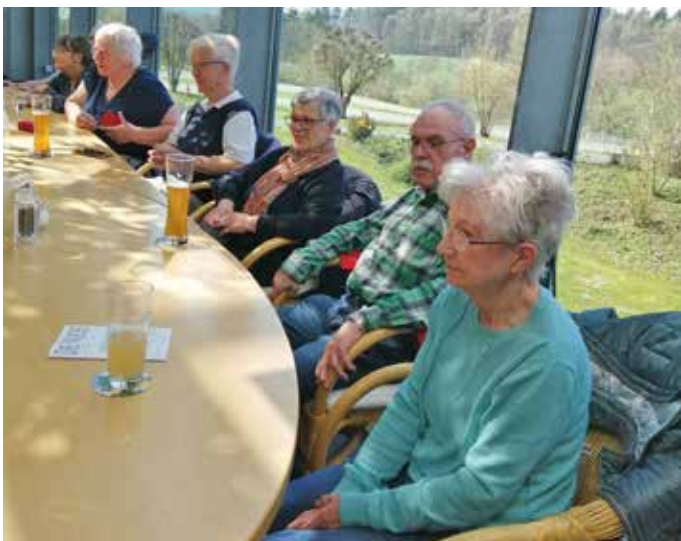
Beim Essen in der Sauerstiftung

Die Kurzstreckler wanderten die gleiche Strecke bei starkem Gegenwind und ca. 22 Grad bis zur Buchwaldhütte und rasteten dort. Dann ging es wieder zurück über die Lobbach-Mückenlocher-Str. zur Sauer-Stiftung. Die Strecke hin und zurück waren ca. 2 km.