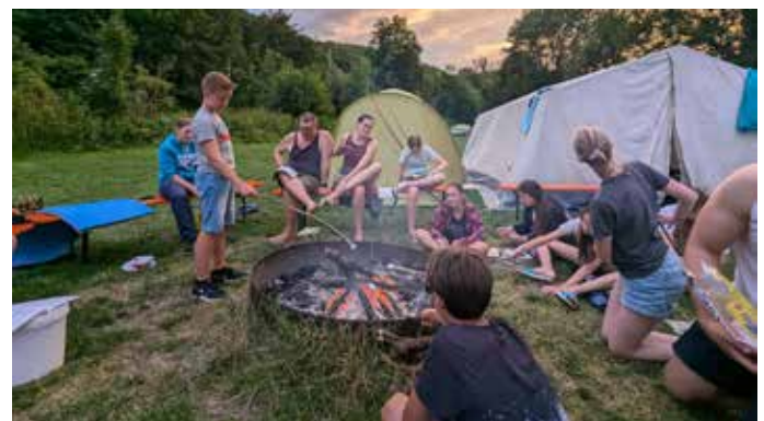
Freiwilliges ökologisches Jahr bei der Naturfreundejugend Baden

Bewerben können sich alle, die zwischen 16 und 27 Jahre alt sind. Wer Interesse hat, ein Jahr lang auf einer Einsatzstelle mit anzupacken, kann sich jetzt schon bewerben. Man sollte nicht zu lange warten, denn die Plätze sind schnell belegt. Schulnoten spielen beim Auswahlverfahren übrigens keine Rolle. Das FÖJ beginnt am 01.09.2025. Die Bewerbungen laufen über die Landeszentrale für politische Bildung. Weitere Informationen zum Freiwilligen Ökologischen Jahr