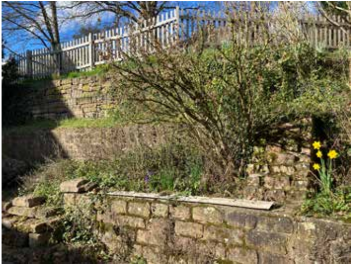
Römische Mauer im Antoniushof.

Im Mittelpunkt standen die beiden römischen Gehöfte (villae rusticae) aus dem 2. und 3. Jahrhundert n. Chr., die auf Wiesenbacher Gemarkung bezeugt sind (Gewann Hirschhag im Herrenwald und Hauptstr. 75-77, heutiger Antoniushof.