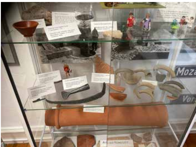
Die römischen Funde werden vorbildlich in den neuen Vitrinen des Heimatmuseums in Wiesenbach präsentiert.

Durch die historisch-geographische Einordnung der Fundplätze wurde deutlich, welche bedeutende Rolle die Gehöfte Wiesenbachs mit ihrer teils monumentalen Architektur im zur Römerzeit sehr dicht besiedelten Raum des Kleinen Odenwalds und Kraichgaus einnahmen. Besonders bemerkenswert ist dabei, dass diese Relikte römischer Geschichte bis heute sehr organisch im Ortsbild Wiesenbachs überdauert haben und nicht – wie lange angenommen – brandschatzenden Alemannen- oder Frankenhorden zum Opfer fielen und zerstört wurden.