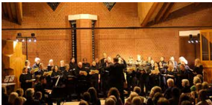
Das ensembleVocal – hier bei der Aufführung des Requiems von Johannes Brahms in der Arche Neckargemünd in 2023 – gastiert am kommenden Samstag in der Kath. Michaelskirche mit einem weltlichen Chorprogramm.