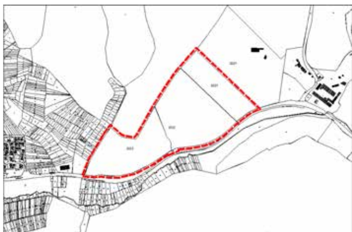
Geltungsbereich des Bebauungsplans und der örtlichen Bauvorschriften „Freiflächensolaranlage Wiesenbach - Langenzell“

Die genaue Abgrenzung des Geltungsbereiches ergibt sich aus dem nachfolgenden Lageplan: