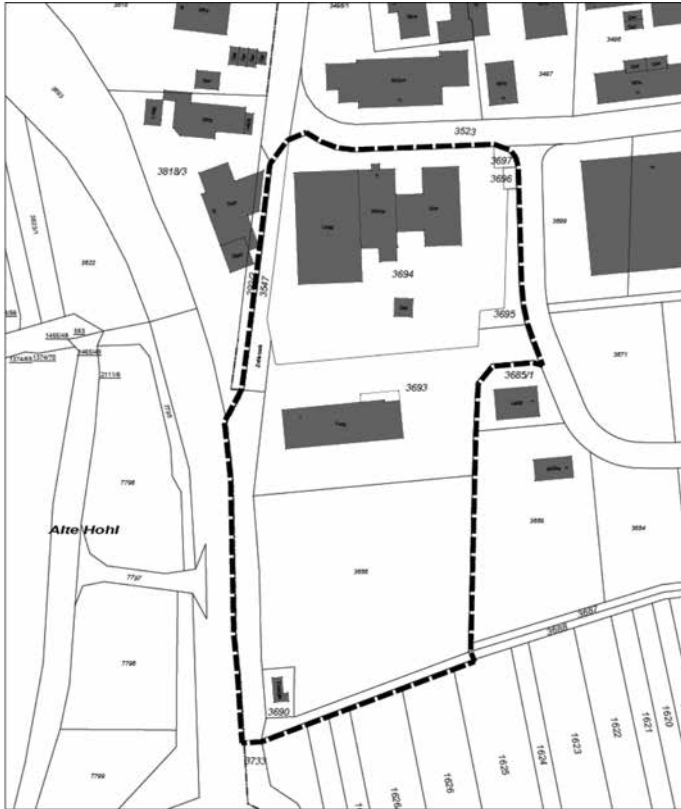
Geltungsbereich des Bebauungsplans und der örtlichen Bauvorschriften „Au – 6. Änderung“

Die genaue Abgrenzung des Geltungsbereiches ergibt sich aus dem nachfolgenden Lageplan: