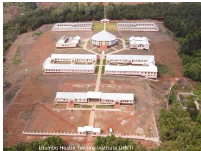
Litembo Health Training Institute LIHETI

Mehr Info/Spenden: www.lichtfuerafrika.de