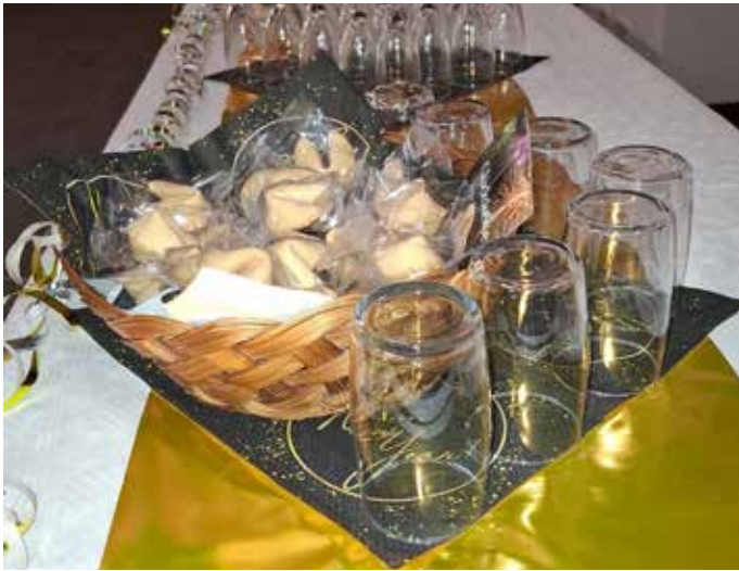
Liebevoll für den Empfang gerichtet mit Glückskecke für das Jahr 2025