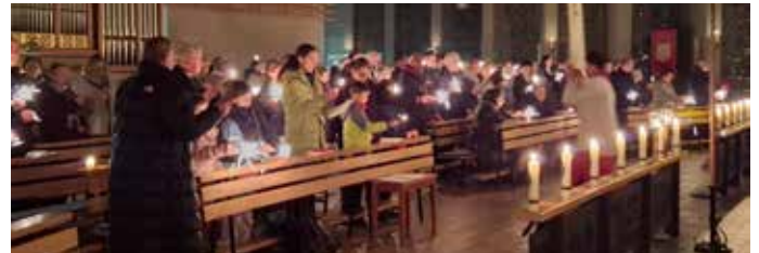
Eucharistischer Segen für das Jahr 2025