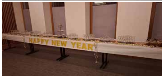
Wunderkerzen zum Lied „Großer Gott wir loben dich“