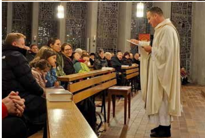
Die Marienkerzen für alle Kirchen wurden entzündet