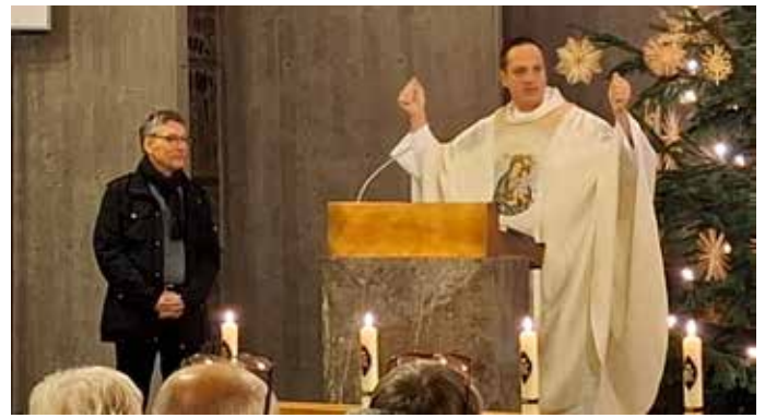
Voller Freude wurden 2 Erwachsene in die katholische Kirche aufgenommen

Nach dem Festgottesdienst wurde zum gemeinsamen Empfang im Vorraum der Kirche eingeladen. Liebevoll wurde hierfür dekoriert und es gab für alle Glückskeckse für ein erfolgreiches Jahr 2025.