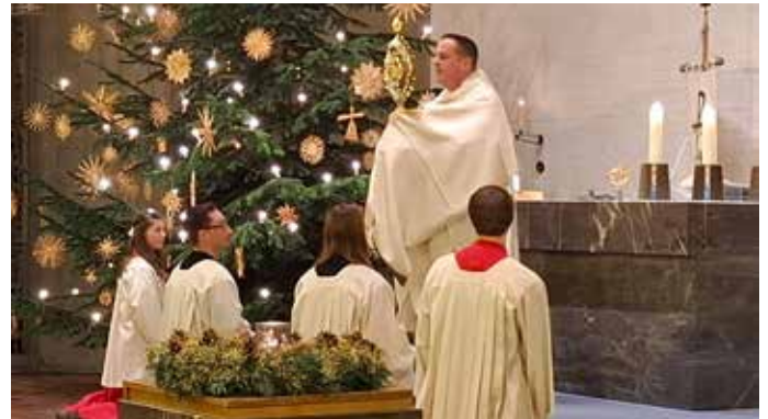
10 jähriges Jubiläum von F. Welz