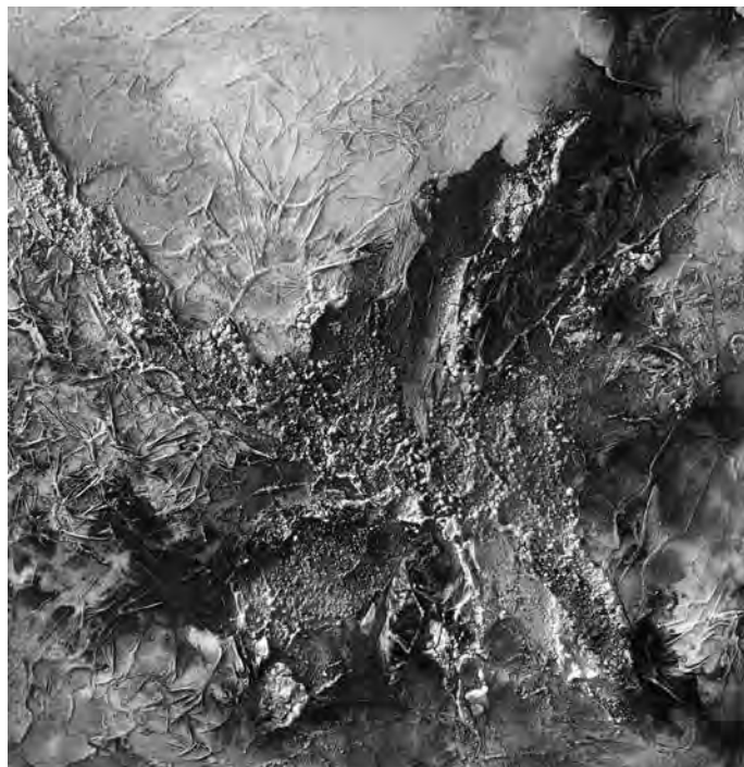
Mit Acrylfarben auf Leinwand zeigt sie uns ihre „Drachenschlucht“. Die Wirkung entsteht über die plastische Farbgestaltung.

Jürgen Berger, Freundeskreis Heimatmuseum - Alte Ziegelei