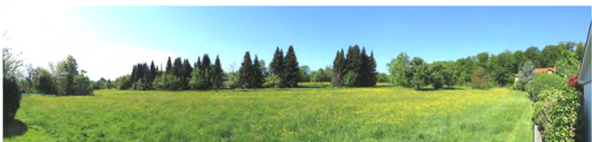
Bild 3: Blick von Südosten, am rechten Rand das bestehende Wohngebiet