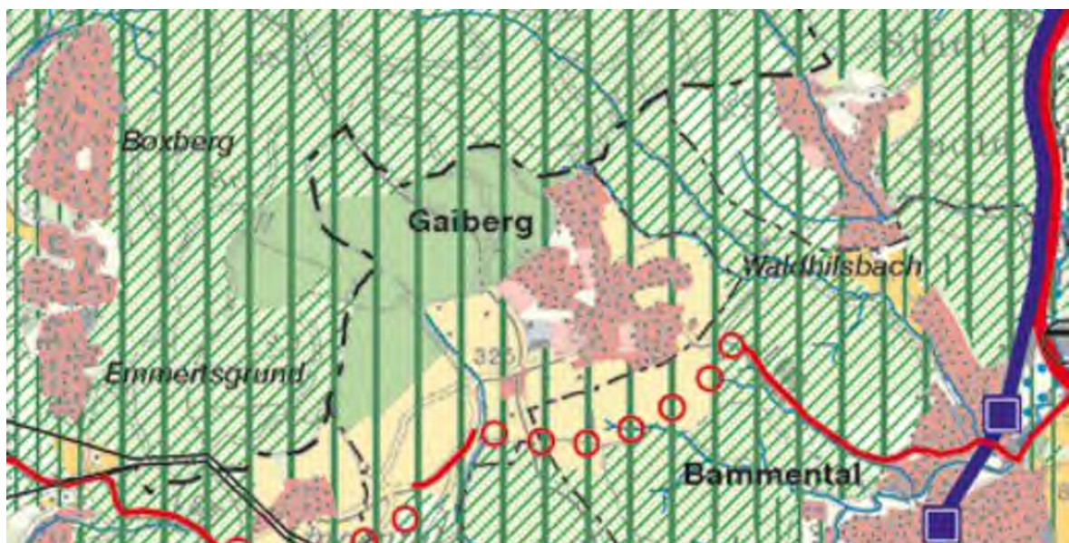
Bild 8: Raumnutzungskarte des Einheitlichen Regionalplans Rhein-Neckar, Ausschnitt Gaiberg

In der Raumnutzungskarte zum Einheitlichen Regionalplan Rhein-Neckar ist das Plangebiet als geplante Wohnbaufläche enthalten. Nördlich, westlich und südlich schließt sich ein regionalplanerischer Grünzug an, der durch die Planung jedoch nicht beeinträchtigt wird.