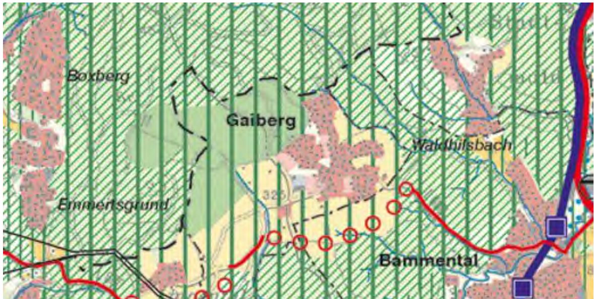
Bild 8: Raumnutzungskarte des Einheitlichen Regionalplans Rhein-Neckar, Ausschnitt Gaiberg