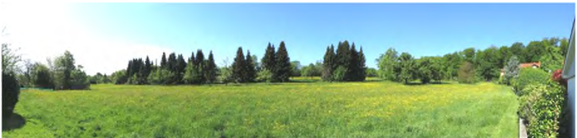
Bild 3: Blick von Südosten, am rechten Rand das bestehende Wohngebiet