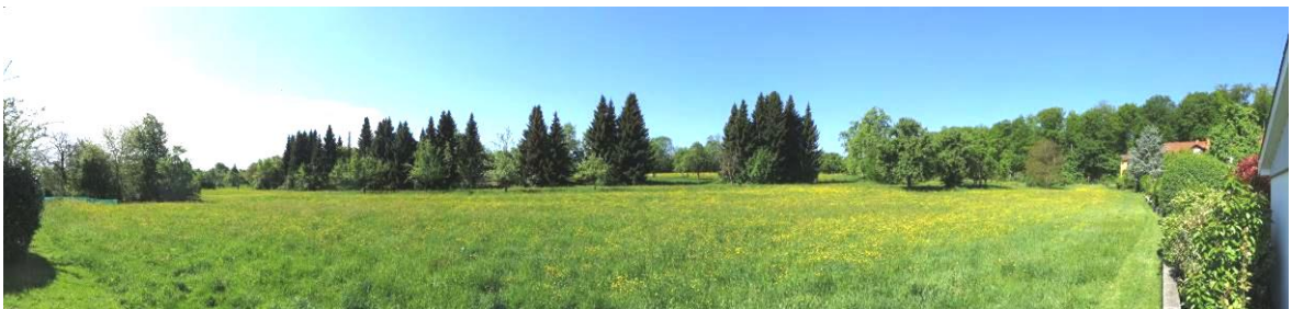
Bild 3: Blick von Südosten, am rechten Rand das bestehende Wohngebiet