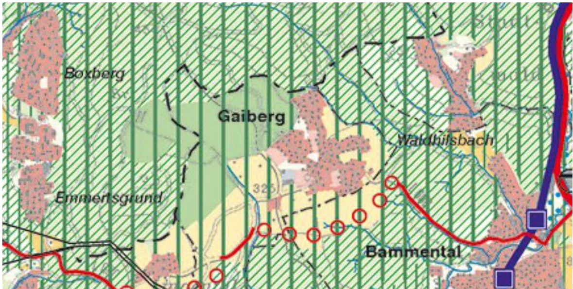
Bild 8: Raumnutzungskarte des Einheitlichen Regionalplans Rhein-Neckar, Ausschnitt Gaiberg