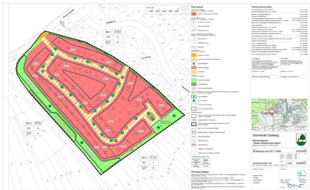
Bild 10: Bebauungsplan „Oberer Kittel/Wüstes Stück“ – Erstes ergänzendes Verfahren

Der Bebauungsplan wurde am 27.02.2019 als Satzung beschlossen. Aufgrund eines Normenkontrollverfahrens wurde ein ergänzendes Verfahren gemäß § 214 Abs. 4 BauGB erforderlich. Dies konnte am 16.12.2020 mit dem erneuten Satzungsbeschluss und der Bekanntmachung am 15.01.2021 abgeschlossen werden. Der Bebauungsplan wurde dabei rückwirkend zum 22.11.2019 in Kraft gesetzt.