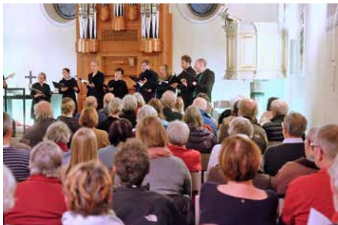
Die Ev. Peterskirche war bis auf den letzten Platz besetzt.