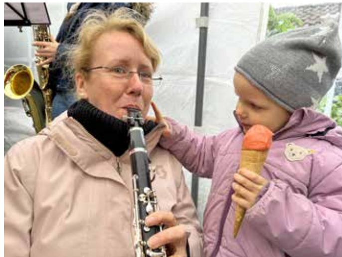
Das Eis schmeckte auch bei herbstlicher Witterung gut.