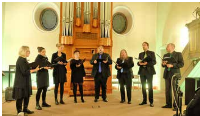
Das Filzbach-Consort aus Mannheim gastiert mit seinem A-Cappella-Programm im Rahmen von „Kultur & Kirche“.

Martin Boeckh, www.kirchenbauverein-gaiberg.de