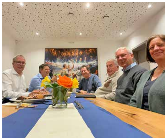
Gemeinderäte und Vorstandsmitglieder der CDU/Bürgervereinigung

Die nächste Möglichkeit sich bei einem öffentlichen Treffen auszutauschen, ist spätestens auf einer Mitgliederversammlung des CDU-Gemeindeverbandes am 26. November dieses Jahres.