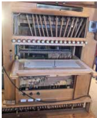
links: Erste Arbeiten am Prospekt.