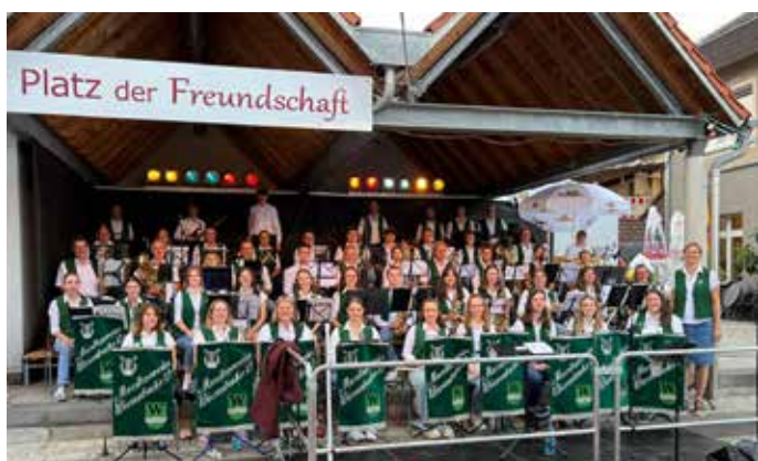
Der MV in seiner ganzen Pracht. Die Bühne wird knapp.