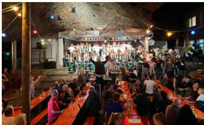
Bei Sierra Madre gibt es kein Halten mehr und die Bänke werden erklommen.

Wir bedanken uns herzlich bei allen Helfer*innen und Unterstützer*innen, sowie den zahlreichen Gästen, denn ohne diese hätte dieses großartige Fest gar nicht stattfinden können und hätte nur halb soviel Spaß gemacht.