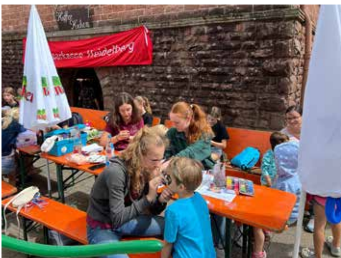
Kinderschminken und Basteln kamen bei den jungen Besuchern sehr gut an.