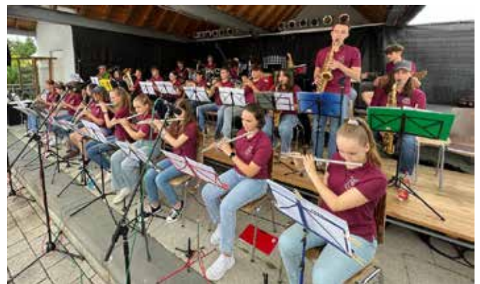
Die Jugendkapelle begeisterte mit dynamischem Satz- und Solospiel.

Wer das Publikum begeistern will, der muss für Abwechslung sorgen. Die Jugendkapelle folgte diesem Grundsatz und hatte sofort die Aufmerksamkeit der Zuhörer auf ihrer Seite. Stücke aus dem Bereich Jazz, Soul und Musical durchsetzt mit spannungsreichen Soli sorgten für kräftigen Applaus und ebenso wie die Hit Kids mussten die Musikerinnen und Musiker der Jugendkapelle eine Zugabe zum Besten geben.