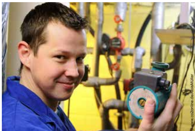
Hocheffizienzpumpen sowie der hydraulische Abgleich werden aktuell über das Zuschuss-Programm „Heizungsoptimierung“ der BAFA gefördert. Fragen Sie im Vorfeld Ihren KLiBA-Berater.

Nutzen Sie die kostenfreie Serviceleistung Ihrer Kommune!