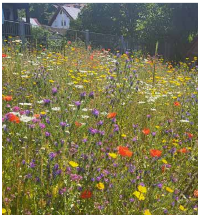
Die neu angelegte Fläche am Wasserspielplatz in Blüte.

Kontakt: Luzy.koertgen@wiesenbach-online.de oder unter Tel. 06223 9502-41