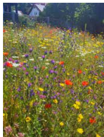
Die neu angelegte Fläche am Wasserspielplatz in Blüte.

In den kommenden Wochen sollen die neuen Blühflächen gejätet werden. Das ist in den Anfangsjahren sehr wichtig, damit sich die gewünschten insektenfreundlichen Stauden etablieren können.