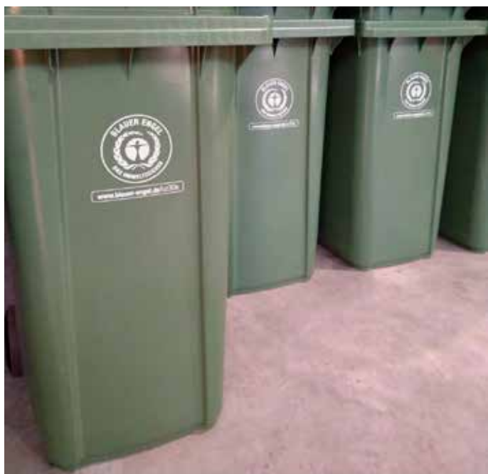
Aus Alt mach Neu: Mit dem Umweltzeichen „Blauer Engel“ gekennzeichnete Grüne Tonnen plus, bestehend aus mindestens 90 Prozent Recyclingmaterial.

Das Symbol „Blauer Engel“, zurzeit das einzige Umweltzeichen für Abfall- und Wertstoffbehälter, ist auf der Vorderseite aller neu ausgelieferten Behälter zu sehen. Das Sortiment umfasst alle Behältergrößen der Restmülltonne, der BioEnergieTonne sowie der Grünen Tonne plus.