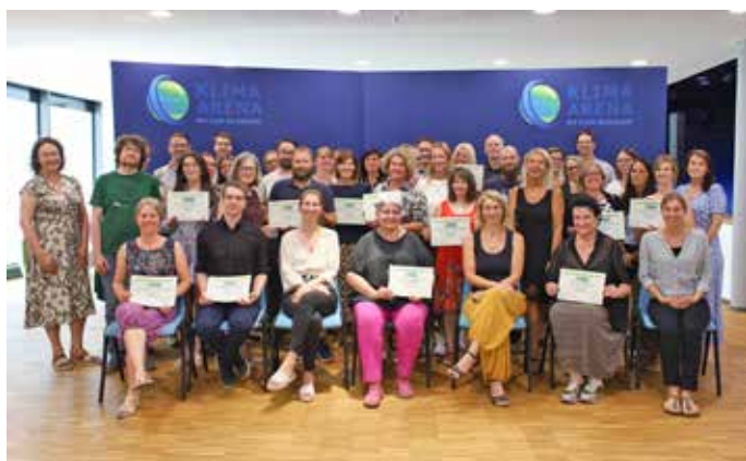
Gruppenfoto der Prämienüberreichung 2023 im Projekt „Dein.Klima“