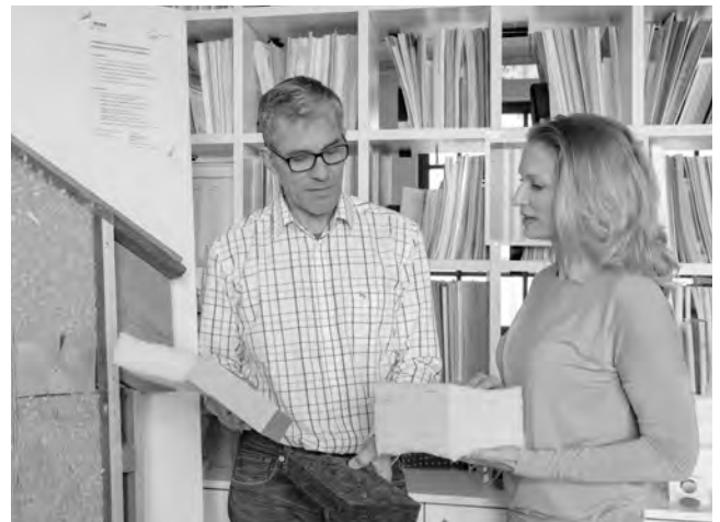
KLiBA-Energieberater informieren Sie umfassend über alle Schritte einer energetischen Sanierung und kennen die richtigen Fördertöpfe.

Nutzen Sie die kostenfreie Serviceleistung Ihrer Kommune!