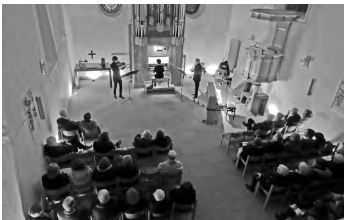
Beim jüngsten Konzert von ‚Kultur & Kirche‘ begeisterte das Trio Klavio mit tänzerischen Weisen aus vielen Jahrhunderten.