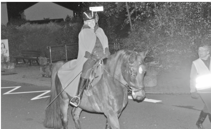
Sankt Martin reitet wieder durch Wiesenbach. Klein und Groß freuen sich schon auf den bunten Laternenumzug.

Liebe Eltern mit Euren Kindern, bitte halten Sie genügend Abstand von der Feuerstelle, um Beschädigungen Ihrer Kleidung zu vermeiden. Vorsorglich weisen wir darauf hin, dass Schadensersatz wegen Funkenflugs beim Martinsfeuer nicht geleistet werden kann. Die Freiwillige Feuerwehr bittet aus Sicherheitsgründen darum, Hunde und brennende Fackeln zu Hause zu lassen. Kulturgemeinschaft 1955 Wiesenbach e.V., Jürgen Berger