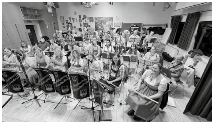
Der Musikverein ist startklar.

Die Halle war gut gefüllt und auch wenn anfangs nur zögerlich die Tanzfläche vor der Bühne betreten wurde, gab es später kein Halten mehr. Gewohnte Stimmungsmacher kamen auch hier gut an und wurden natürlich auch gesanglich mal wieder großartig begleitet.