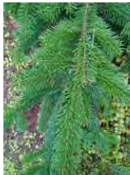
Kreisforstamt des Rhein-Neckar-Kreises bietet wieder Schmuckreisig zum Kauf an.

Das Kreisforstamt des Rhein-Neckar-Kreises bietet in diesem Jahr wieder Schmuckreisig zum Kauf an. Die frischen Zweige stammen von Nord-