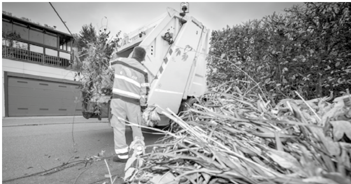
Nach vorheriger Anmeldung wird Grünschnitt holzig direkt vor dem Grundstück abgeholt. AVR Kommunal AöR

Zum Grünschnitt holzig gehören Äste und Zweige sowie Strauch-, Baum- und Heckenschnitt aus der häuslichen Gartenpflege. Die einzelnen Stücke dürfen bis zu 1,5 Meter lang und maximal 25 Kilogramm schwer sein sowie einen Durchmesser von höchstens 20 Zentimetern haben. Die Gebühr für eine Abholung von Grünschnitt holzig bis zu einer Menge von einem Kubikmeter beträgt 9 Euro, bis zu zwei Kubikmetern 16 Euro. Für Mehrvolumen je angefangene zwei Kubikmeter fallen weitere 9 Euro an.