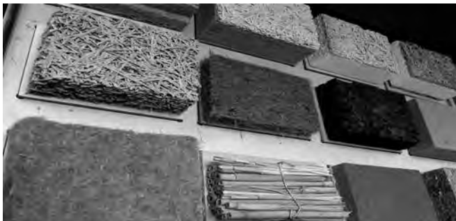
Dämmstoffe gibt es aus vielen verschiedenen Materialien mit unterschiedlichen Eigenschaften. Entscheidend für den Erfolg ist die fachgerechte Ausführung durch den Handwerker.

Die Beratungen finden statt in Bammental : alle vierzehn Tage, donnerstags, zwischen 15:30 und 17:30 Uhr. In Gaiberg alle 4 Wochen, montags zwischen 16 und 18 Uhr in Wiesenbach alle 4 Wochen, montags zwischen 16 und 18 Uhr. Termine bekommen Sie direkt bei der KLiBA in Heidelberg, Tel. 06221 99875-0 oder E-Mail: info@kliba-heidelberg.de .