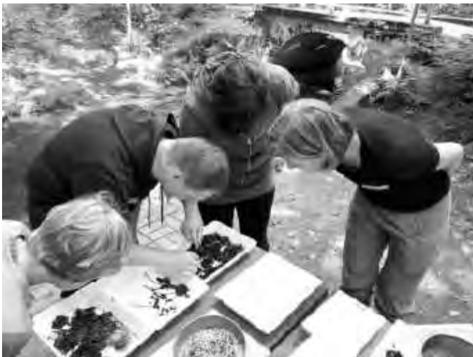
Forschungseinsatz im FLOW-Projekt

Im Folgenden finden Sie Fotos, welche Sie honorarfrei unter Angabe der Autoren (s. Abbildungsbeschriftung) und im Zusammenhang mit dem BUND verwenden können.