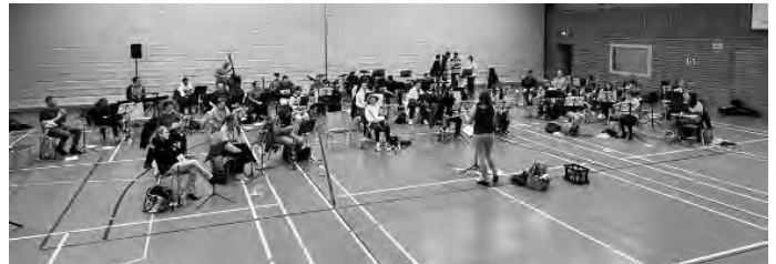
Probe für das Frühlingskonzert am 7. Mai 2022

Kontrabass, Vibraphon, Kesselpauken und natürlich wie immer Blech- und Holzblasinstrumente, Keyboard, Gitarre, Bass, Schlagzeug und Gesang. Alles auf Abstand und alle voll motiviert für unser Konzert.