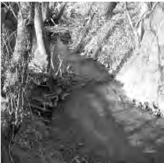
Biddersbach kurz vor der Mündung in die Elsenz