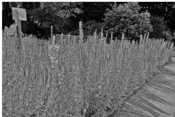
Auf „Natur nah dran“-Flächen entstehen vielfältige Pflanzengemeinschaften.

In der zweiten und weiter entwickelten Projektrunde werden von 2022 bis 2027 jährlich 15 weitere Städte und Gemeinden unterstützt. „Natur nah dran 2.0“ wird durch das Ministerium für Umwelt, Klima und Energiewirtschaft Baden-Württemberg gefördert.