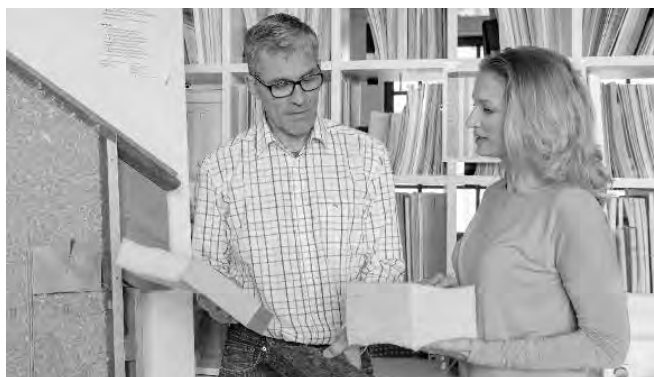
Energieberatung bei der KLiBA.

Termine bekommen Sie direkt bei der KLiBA in Heidelberg, Tel. 06221/99875-0 oder E-Mail: info@kliba-heidelberg.de .