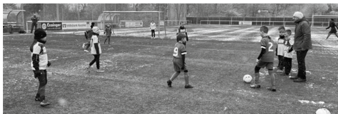
Auch beim Training ist immer viel los auf unserem Sportplatz.