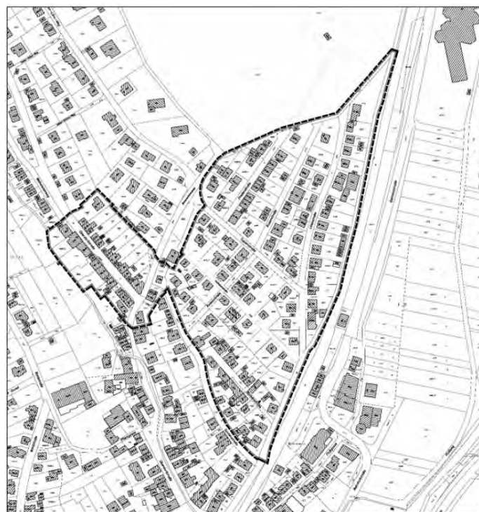
Geltungsbereich des Bebauungsplans mit örtlichen Bauvorschriften „Hofäcker“ Offenlage

4466/3, 4468, 4469, 4470, 4470/2, 4471, 4471/2, 4471/3, 4471/4, 4472, 4472/1, 4472/3, 4473, 4473/1, 4474, 4474/2, 4481, 4481/1, 4481/2, 4481/3, 4481/4 4481/5, 4481/6, 4481/7, 4481/8, 4482, 4482/1, 4482/2, 4483, 4483/1, 4483/2, 4484/3, 4609, (Bammertsbergstraße, teilweise), 5684 (Weg), 5685 (Hofäckerstraße), 5686 (Rosenstraße), 5687 (Rosenstraße), 5765, 5766, 5767, 5768, 5769, 5770, 5771, 5772, 5773, 5775, 5776 (Rosenstraße), 5777, 5778, 5779, 5780, 5780/1, 5781, 5782, 5782/1, 5782/2, 5783, 5783/1, 5785, 5786, 5787, 5787/1, 5790, 5791, 5792, 5793, 5795, 5795/1, 5796, 5797, 5798, 5799, 5800, 5802, 5803, 5804, 5805, 5806, 5808 (Fliederstraße), 5810 (Lilienstraße) und 6093 (Grünfläche).