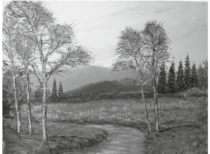
Mit seinen stimmungsvollen Darstellungen gelingt es dem Künstler die flüchtigen Momente der Natur fest zu halten.