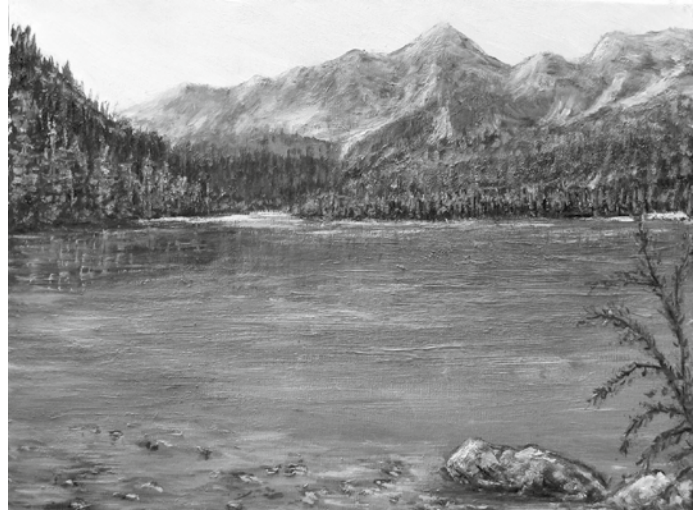
Die große Liebe zu seiner Heimat ist in seinen Landschaftsbildern zu spüren.