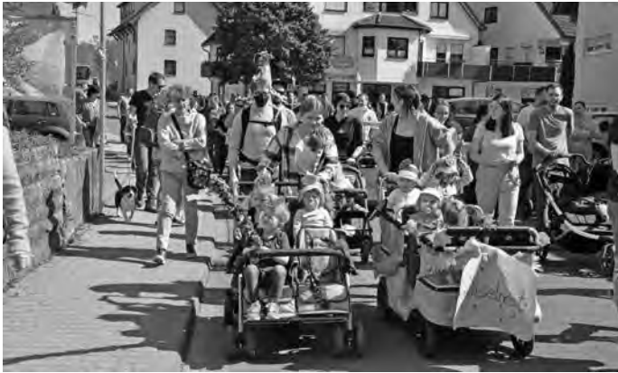
Die Kleinkindgruppen mit ihren Kinderbussen