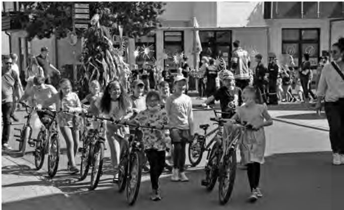
Stolz laufen die Kinder neben ihren bunt umrankten Rädern und Rollern.