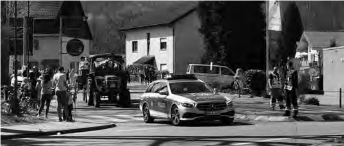
Ludwig Mossau, Leiter Presse- und Öffentlichkeitsarbeit, Freiw. Feuerwehr Bammental