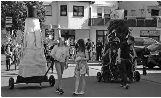
Sommer und Winter wurden durch ein dichtes Besucherspalier unserer die Gemeinde zum Biddersbachhallen-Parkplatz geleitet.